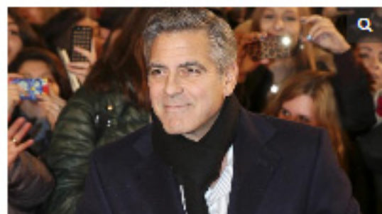
George Clooney

L'effetto del bel George sta richiamando frotte di turisti di statunitensi in vista a Pontremoli